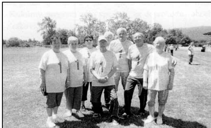
Súťažné družstvo ZO JDS Sačurova na celookresných športových hrách členov Jednoty dôchodcov v Sečovskej Polianke dňa 16. júna tohto roku.

Naša základná organizácia združuje už 69 členov, ktorí sú zároveň organizovaní aj v ďalších zložkách, ktoré pôsobia na území našej obce. V ďalšom období preto počítame, že s nimi budeme spolupracovať pri organizovaní rôznych kultúrnych či športových