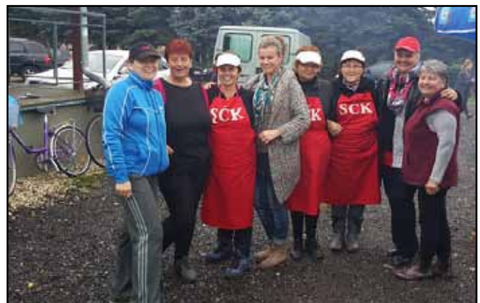
Sačurovský kotlíkový guláš