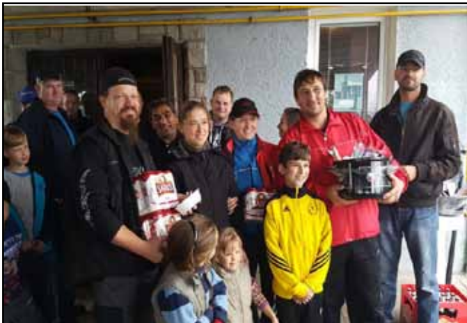
Sačurovský kotlíkový guláš